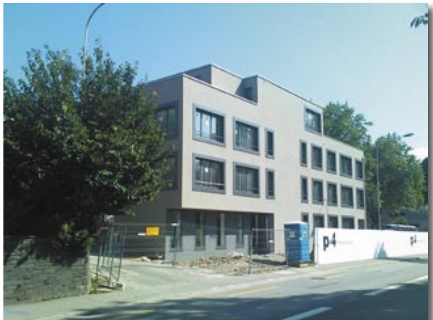
Artherstrasse 9 - heute und früher (oben)

Es geht nicht darum, alte Bauten und Quartiere oder gar Stadtteile unter eine Glasglocke zu stellen. Es geht aber darum, sie mit klugen Projekten für die heutigen Lebensräume zu nutzen und aus der Verbindung von Alt und Neu einen Mehrwert zu schaffen. Mit unüberlegten Eingriffen können unsere Ortsbilder massiv verletzt werden. Das nach dem Abbruch des alten Hotels Hirschen im Jahre 1960 gebaute Bürohaus Zentrum war ein erstes Negativbeispiel. Damals begann die Beeinträchtigung unseres Stadt- und Ortsbildes.