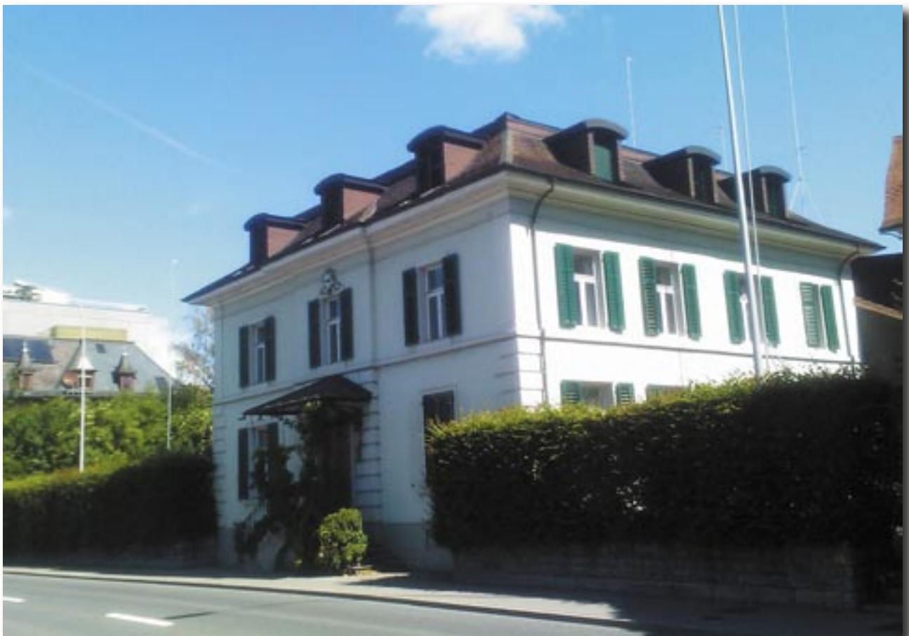
ehemaliges Kirschwasserhaus an der Chamerstrasse

Redaktion und Gestaltung: Rainer Walser-Fraefel